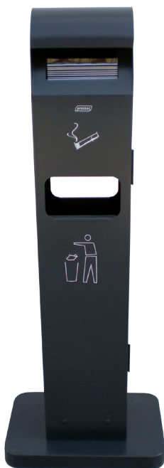
8 99 615