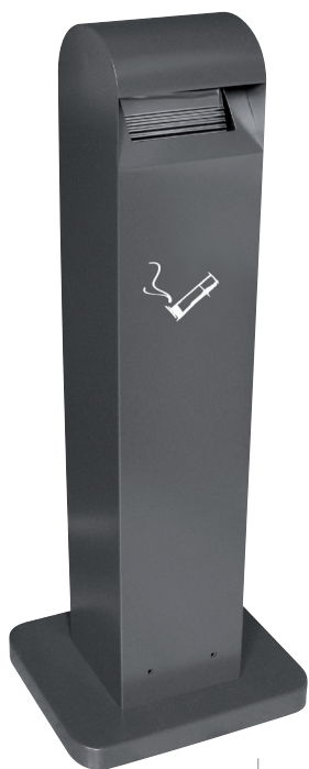
8 99 503