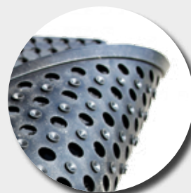
Face inférieure avec ventouses