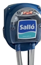
DOSEUR PERISTALTIQUE Réf 120651