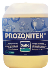
PROZONITEX ACTIVATEUR POUR EAUX OZONÉES Bidon de 11 kg Réf 120652