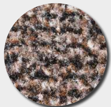
Fibres grattantes + absorbantes mouchetées