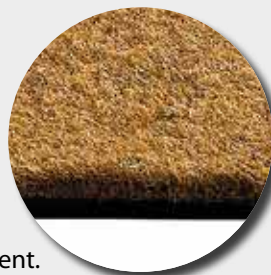
Semelle en caoutchouc recyclé

fibres de polypropylène aiguilletées sur semelle caoutchouc recyclé