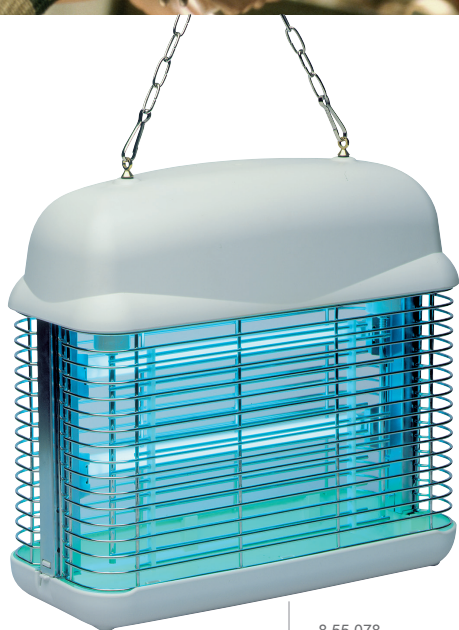
8 55 078

SURFACE PROTÉGÉE INDICATIVE 30 W = 80 m 2