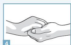
4 Dos des doigts contre la paume opposée avec les doigts emboîtés.