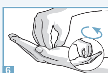
6 Friction en rotation en mouvement de va-et-vient avec les doigts joints de la main droite dans la paume gauche et vice versa.