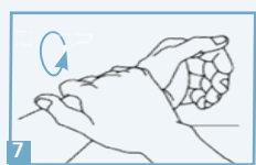
7 Friction des poignets par rotation.