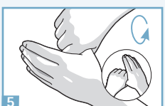
5 Friction en rotation du pouce droit enchâssé dans la paume gauche et vice versa.