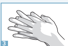
3 Paume contre paume avec les doigts entrelacés.