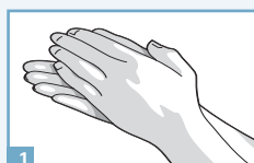
1 Paume contre paume.