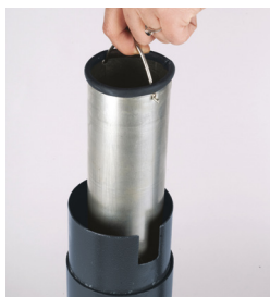
BAC INTÉRIEUR GALVANISÉ