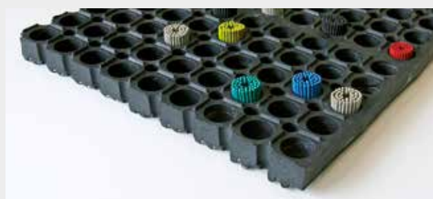
M26 + brosses