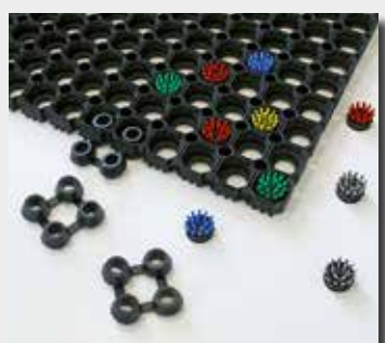
Brosses + jonctions