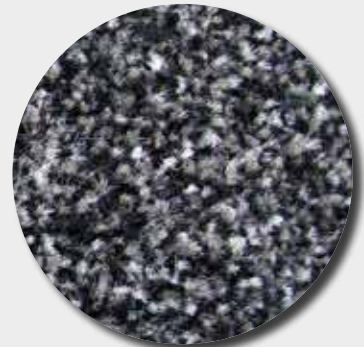
Fibres de polyamide mouchetées