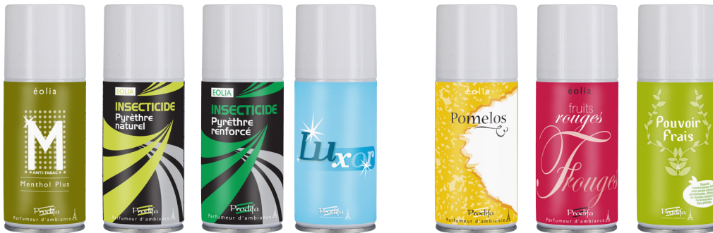
Traitement / Treatment